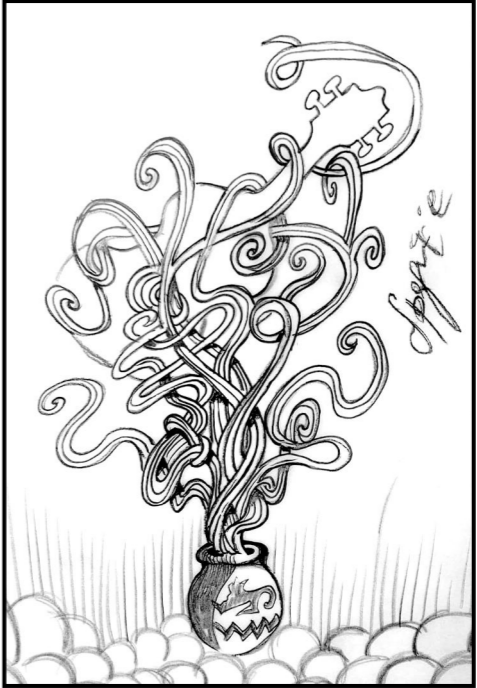
Illustrazione di Steve Sperguenzie

della raccolta, sarà destinato alle associazioni che portano concerti e musicoterapia negli ospedali pediatrici. Per garantire trasparenza assoluta, i fondi saranno custoditi in un conto separato fino alla conclusione del progetto e distribuiti con il supporto di Orchestra Srl, che permetterà di monitorare come ogni euro viene impiegato dai beneficiari.